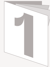
voorzijde / buitenkant